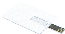
Rys. 2. Materiał poglądowy

2) Pendrive (pamięć USB, min.8 GB) o wymiarach 86 x 54 x 2mm w kształcie karty z dwustronnym nadrukiem grafiki reklamowej Petbottle (100 szt.)