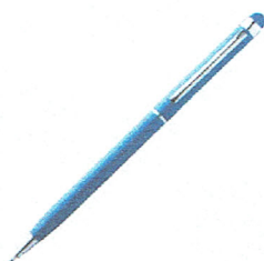
Rys. 3. Materiał poglądowy

3) Długopis typu „touch tip” z grawerem logo Petbottle oraz adresem firmowej strony internetowej. Korpus wykonany z aluminium, skuwka z metalu, kolor niebieski, końcówka przystosowana do ekranów dotykowych (200 szt.)